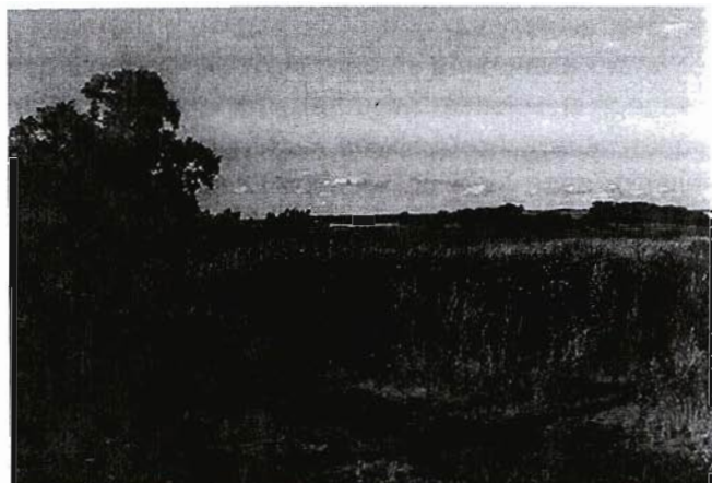
Грустный вид на село Бессоново

И особое внимание надо обратить на те села и деревни, которые находятся не дальше чем в 30 километрах от городов, в зоне доступности от них. Уверю вас, там найдется множество поселений с заброшенными, пустующими участками. Из 3 тысяч наших сел и деревень, может быть, где-то 500 находятся в этой близости от городов. Вот она, благодатная почва для роста. Так зачем татарстанцам, в том числе и многодетным, искать свои колышки в поле, если можно построить дом в селе, недалеко от города? Сразу снимается проблема коммуникаций – там они какие-никакие, но есть. Как минимум есть дороги, есть магазин, почта... Школьные автобусы развозят детей на учебу. То есть можно решить проблему и со школой, и с детским садом, и не надо их строить в чистом поле – просто увеличить вместимость школы в райцентре. В 30-километровой зоне можно предоставлять не гектар, а, например, полгектара, или 25 соток. Кстати, по жизни оптимальна для ведения личного подсобного хозяйства площадь от 15 до 25 соток. Столько и выделяют сельским жителям для собственного дома. В этом предложении нет ничего особенно нового, это опыт, практика европейских стран, они идут по этому пути.