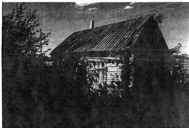
На этом участке в Старых Бурундуках жил брат деда Нилова