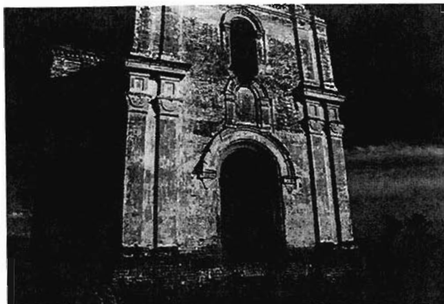
Руины Никольской церкви 19 века в Старых Бурундуках

– Приведу пример еще одной деревни в 20 километрах от Бессоново – Старые Бурундуки Тетюшского района, там родились моя мама, мой дедушка по материнской линии, мой прадед. Эта деревня официально ведет свою историю – только представьте – с 2000-х годов до нашей эры! Расположена деревня в излучине красивой реки Свияги. В XIX веке там была построена уникальная Никольская церковь. В Старых Бурундуках десятилетиями действовал маслосырзавод, выпускал вкуснейший пошехонский сыр. В моем детстве в родной деревне было не менее 300 домов. Были улицы – Чувашская, Татарская и Русская. Это была крепкая, процветающая деревня. А что сейчас? Считанные избы остались. На месте дома, где родился мой прадед, торчит только остов печи. Там, где родились мой дед и моя мама, – пустырь, ковыль растет. Опустел дом, где жил мой дядя, он недавно умер, окна заколочены... Эти жалкие остатки деревни хорошо видны на аэрокосмической карте. А вот если посмотреть на такую же карту, например, в США, взять практически любой случайный фрагмент американской территории – это одна сплошная деревня.