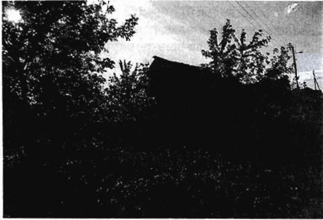
Вид на село Бессоново – так оно выглядит сегодня