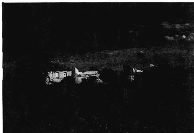
Остатки маслосырзавода в Старых Бурундуках