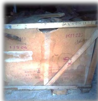
Неиспользуемое имущество (хозяйственная постройка, оборудование) в Казанском и Чистопольском психоневрологических интернатах

Интернатами не соблюдались нормы обеспечения по отдельным видам мягкого инвентаря и продуктов питания. При этом если установленные нормы питания по отдельным видам продуктов не выполнялись (рыба, сухофрукты, фрукты, кондитерские изделия), то по другим продуктам питания наблюдалось их превышение (крупы, бобовые и макаронные изделия).