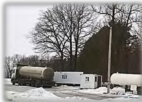
Объекты сервисных дорожных служб, расположенных на землях вдоль трассы в г. Нижнекамск