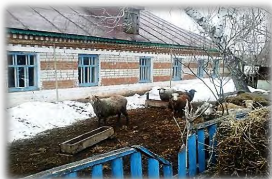
Здание общеобразовательной школы по адресу: д. Верхнее Балтаево, ул. Сайдашева, д.79