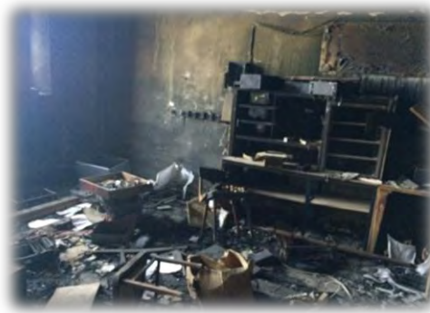
Неиспользуемое здание автоматической телефонной станции по адресу: г. Зеленодольск, пр. Строителей, д.36

По итогам проведенного аудита подготовлены рекомендации по совершенствованию нормативного правового обеспечения реализации мер государственной поддержки, усилению внутреннего финансового контроля, применению системы управления рисками, внедрению информационных технологий при осуществлении мониторинга.