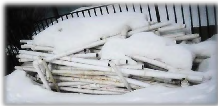
Демонтированная система отопления жилого дома в пгт. Кукмор, ранее капитально отремонтированная

В рамках проведенного в 2014 году в 3 домах пгт. Кукмор капитального ремонта были выполнены работы по ремонту системы теплоснабжения. В 2015 году в связи с переводом на индивидуальное отопление настенными котлами, указанная система теплоснабжения была полностью демонтирована. Данные работы на общую сумму 3 737 тыс. рублей проведены без соблюдения принципа результативности и эффективности использования бюджетных средств.