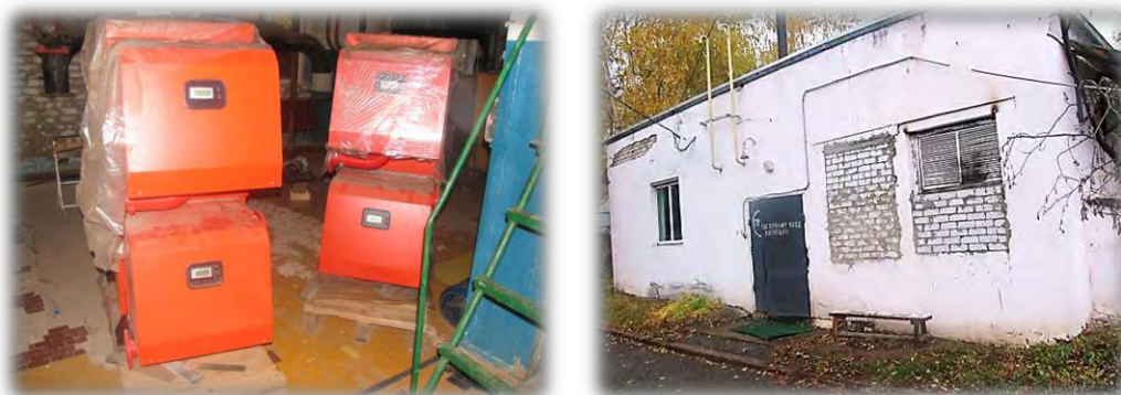
Неиспользуемое оборудование в ГАУЗ «Республиканский клинический неврологический центр»

Например, в ГАУЗ «Республиканский клинический неврологический центр» с августа 2008 года не эксплуатировалось энергетическое оборудование (котлы отопительные) общей стоимостью 2 495,3 тыс. рублей.