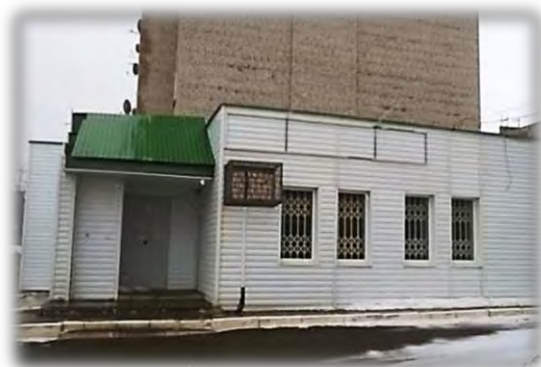
Административное здание по адресу: г. Чистополь, ул. Ногина, 6

При проверке Палаты имущественных и земельных отношений Апастовского муниципального района установлено, что нефинансовые активы имущества казны в количестве 8 единиц (здания общеобразовательных школ, детского сада, поликлиники) общей балансовой стоимостью 6 200 тыс. рублей не эксплуатировались.