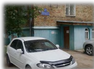
Неиспользуемое имущество и основные средства в Казанском автотранспортном техникуме им. А.П. Обыденнова