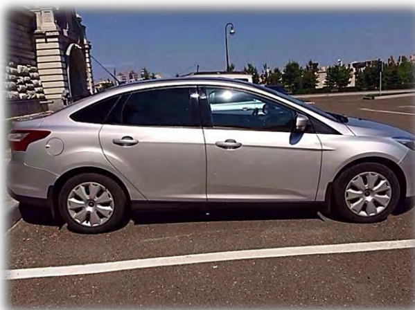
Автомобиль Ford Focus Sedan, содержащийся за счет Республиканской станции по борьбе с болезнями животных, фактически использовался центральным аппаратом Управления

Аппарат Управления неправомерно использовал автотранспортные средства в количестве 8 единиц общей стоимостью 4 224,7 тыс. рублей, числящиеся на балансе у подведомственных организаций (Ветеринарное объединение г. Казани, Республиканская станция по борьбе с болезнями животных). На содержание указанных легковых автомобилей за проверяемый период подведомственными учреждениями затрачено 2 478,3 тыс. рублей.