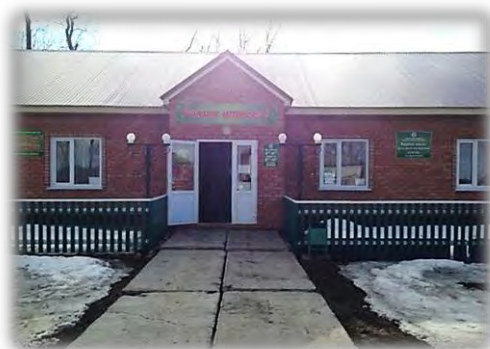
Сельские клубы в с. Мазиково Ишеевского сельского поселения и в с. Карабаево Староюмралинского сельского поселения

В составе основных средств исполкома Гутаевского сельского поселения ошибочно числилось здание музея Сары Садыковой балансовой стоимостью 800 тыс. рублей, фактически являющееся филиалом МБУ «Апастовский краеведческий музей».