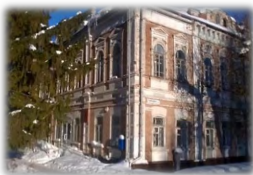
Административное здание по адресу: г. Бугульма, ул. Октябрьская, 4

В ходе проверок выявлялись факты неэффективного использования объектов и имущества, находящихся в муниципальной собственности. Так, стоимость невостребованных объектов недвижимого имущества в Бугульминском муниципальном районе (административное здание, нежилые помещения, производственная база) составила 6 340 тыс. рублей, в Чистопольском муниципальном районе не эксплуатировались, в отдельных случаях более 3 лет, 14 объектов недвижимого имущества (административное здание, нежилые помещения, производственная база) общей стоимостью 4 876 тыс. рублей.