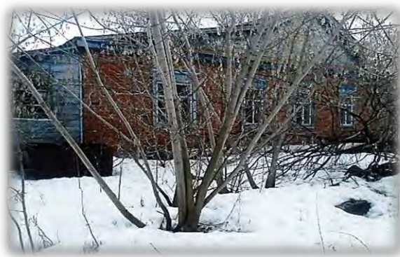
Здание детского сада по адресу: д. Курмашево, ул. Молодежная, д.41

В составе объектов незавершенного строительства в исполкомах Ишеевского и Староюмралинского сельских поселений Апастовского муниципального района числились введенные в эксплуатацию в январе 2013 года и в ноябре 2014 года два сельских клуба (в селах Мазиково и Карабаево) общей стоимостью 4 700 тыс. рублей.