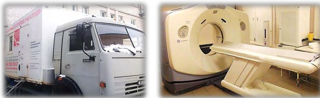
Маммографический кабинет на базе автомобиля КамАЗ 57531 и магнитно-резонансный томограф Signa

Выявлены факты длительной не востребоваемости медицинского оборудования, в ряде случаев более 3 лет (рентгеновский аппарат С-Дуга V-25, рентгеновская система SFX-15).