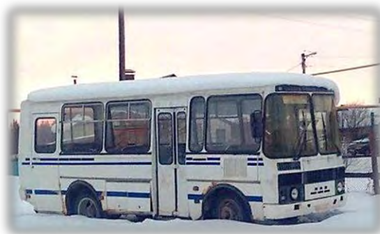
Неиспользуемый в Большесардекской гимназии Кукморского муниципального района автобус ПАЗ-3205, 2001 года выпуска

В ходе проверок выявлялись факты неэффективного использования объектов и имущества, находящихся в муниципальной собственности. Так, стоимость невостребованных объектов недвижимого имущества в Бугульминском муниципальном районе (административное здание, нежилые помещения, производственная база) составила 6 340 тыс. рублей, в Чистопольском муниципальном районе не эксплуатировались, в отдельных случаях более 3 лет, 14 объектов недвижимого имущества (административное здание, нежилые помещения, производственная база) общей стоимостью 4 876 тыс. рублей.