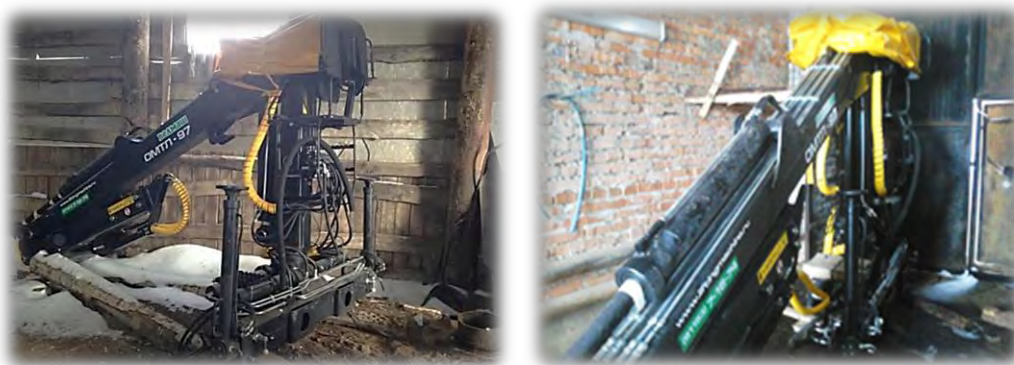
Неиспользуемый погрузочный гидроманипулятор

Например, в ГБУ «Мамадышский лесхоз» и ГБУ «Бугульминский лесхоз» до проведения контрольного мероприятия не эксплуатировались 2 погрузочных гидроманипулятора, приобретенных Министерством в октябре 2015 года и переданных в подведомственные учреждения.