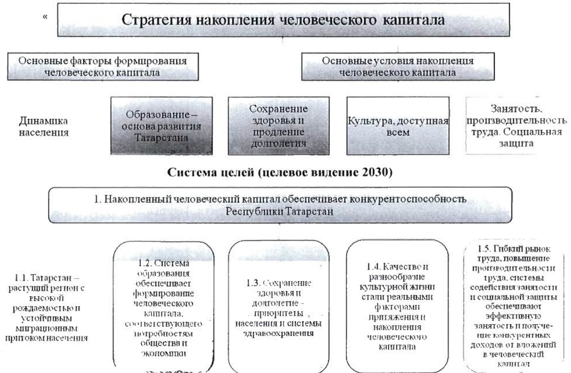
Рис. 3.1. Структура и система целей Стратегии накопления человеческого капитала»